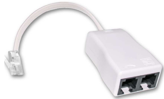
Z-369P2J microfiltro residencial ADSL